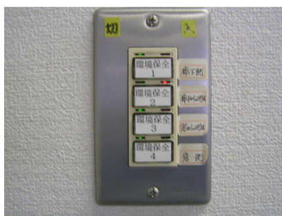
照明スイッチ箇所の表示